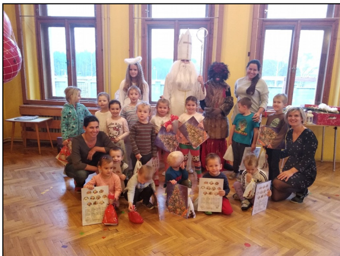
Děti a zaměstnanci MŠ

A závěr prosince? Krásný a slavnostní. Vánoční nálada, vůně cukroví od maminek, koledy - to vše charakterizovalo naši vánoční slavnost, která pomyslně zakončila naše vánoční putování. Tělocvičnou naší mateřské školy se rozezněly koledy a básničky naší Vánoční slavnosti. Naše děti si pro své blízké připravily v duchu kadovských Vánoc pásmo plné krásných písniček zpívaných i na flétnu hraných, básniček a tanečků. A protože byly děti velmi šikovné a celé vystoupení se jim moc a moc povedlo, Ježíšek je hned druhý den odměnil. Pod stromem v tělocvičně jim zanechal ale opravdu obrovskou hromadu dárků - no, však se podívejte. Všem rodičům, prarodičům a návštěvníkům naší slavnosti velmi děkujeme za účast a v roce 2019 přejeme zdraví, štěstí a splněná malá i velká přání.