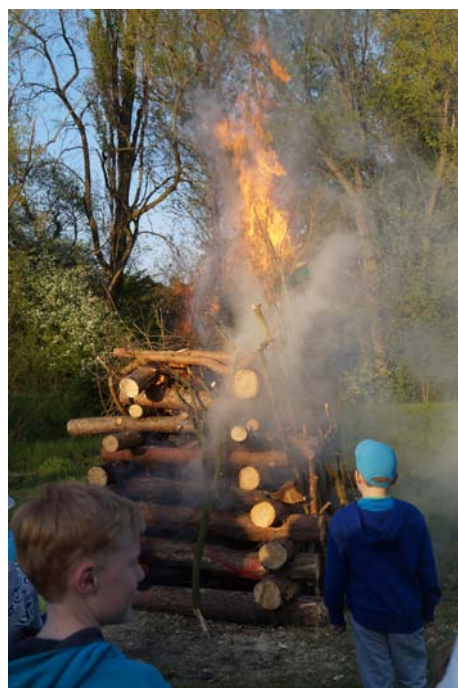
arod jnice ve Šnepov