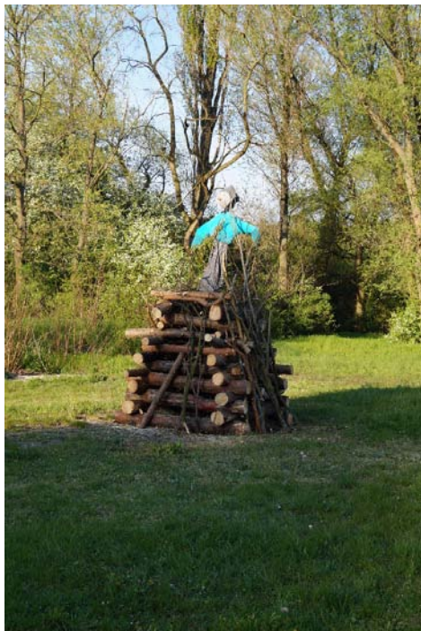
arod jnice v Ostré