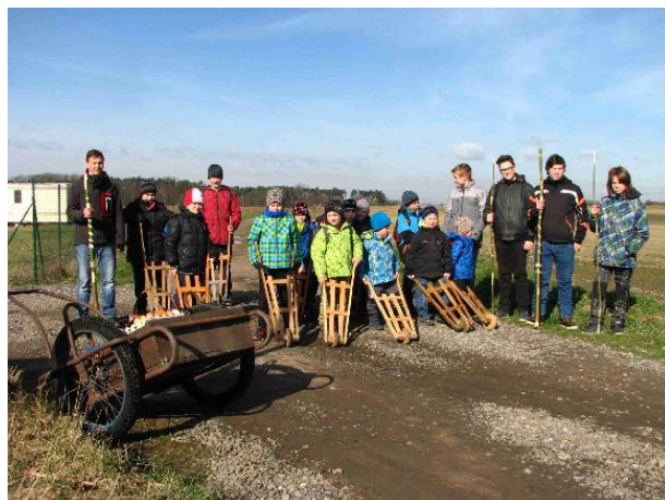
Velikonoce si užívali i naši "páni kluci", kterým děkujeme za udržování tradice!

K zajištění bezpečnosti na zahradě školky objednala starostka obce firmu, která provede redukci a ošetření jehličku a javoru na školní zahradě, výměnu vazbu a provede bezpečnostní řez hlošiny.