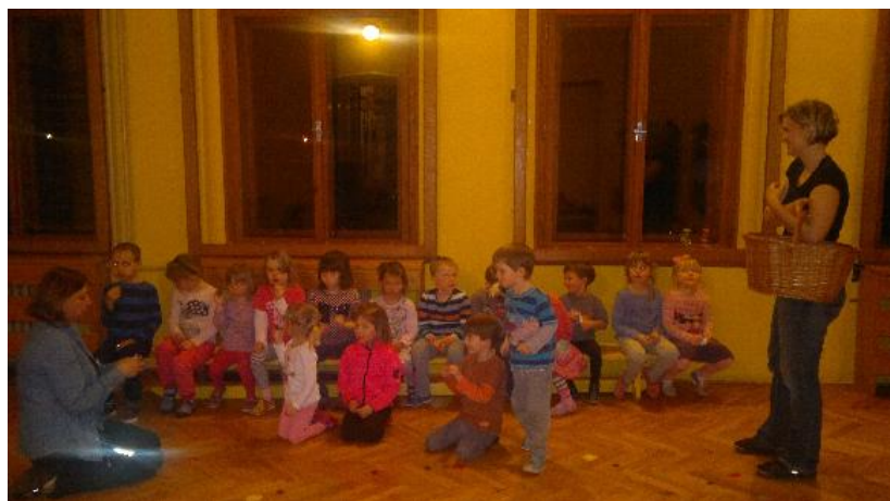
Maminkám tímto také děkujeme za pomoc.

Vstupné bylo dětem hrazeno z výtěžku akce "Vítání Adventu v Ostré".